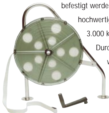
Ankarolina 56 für größere Yachten bis zu 50 Fuß (ca. 15 Meter).

Ankarolina besteht aus einer Trommel, die einfach und schnell an Bug- oder Heckkörben, im Ankerkasten, am Süllbord oder anderswo