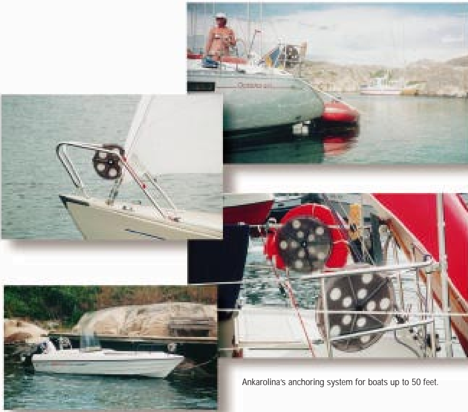
Ankarolina's anchoring system for boats up to 50 feet.