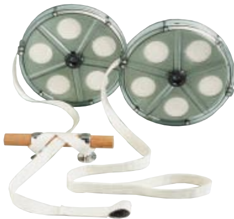
Ankarolina 35 mit Gurtschlaufe für Ankerketten und Ankarolina 24 mit Festmacherschlaufe.