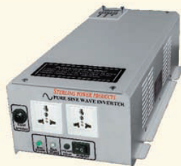
400W mit UPS