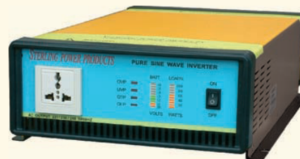
1500W mit UPS